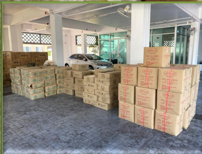
ประมวลภาพการจับกุมและตรวจยึดของกลาง