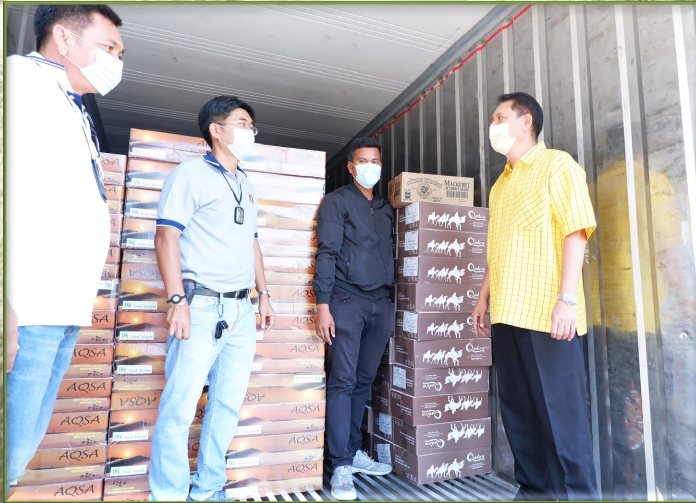
ประมวลาภาพการจับกุมและตรวจยึดของกลาง