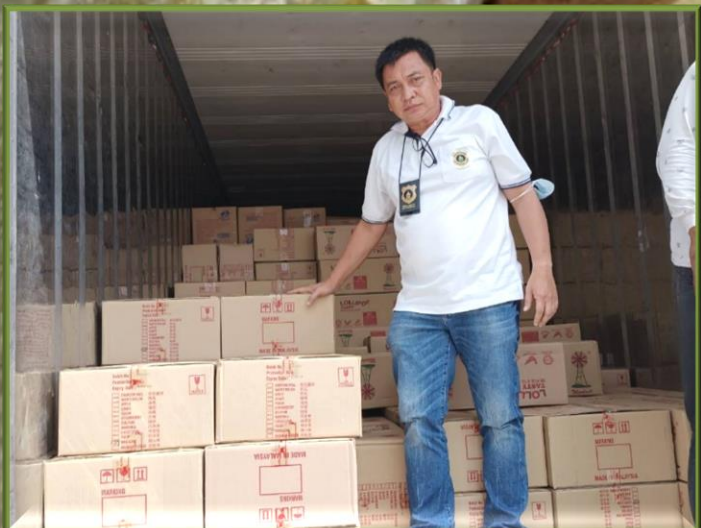
ประมวลภาพการจับกุมและตรวจยึดของกลาง