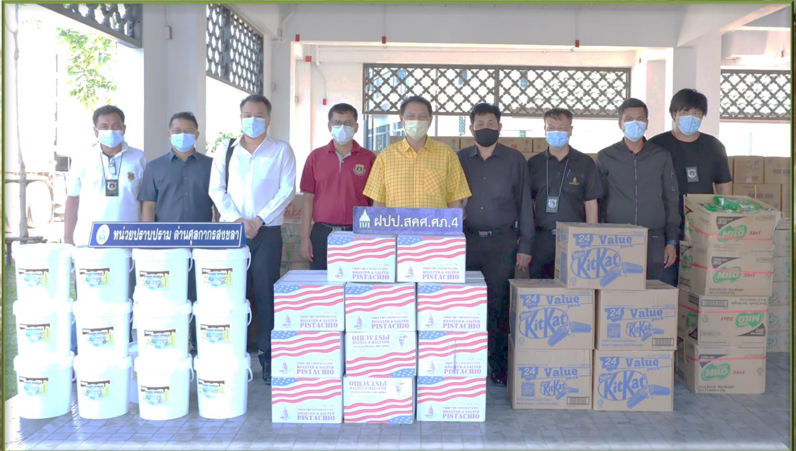
ประมวลภาพการจับกุมและตรวจยึดของกลาง